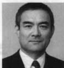
辻 萬長 (吉野作造)